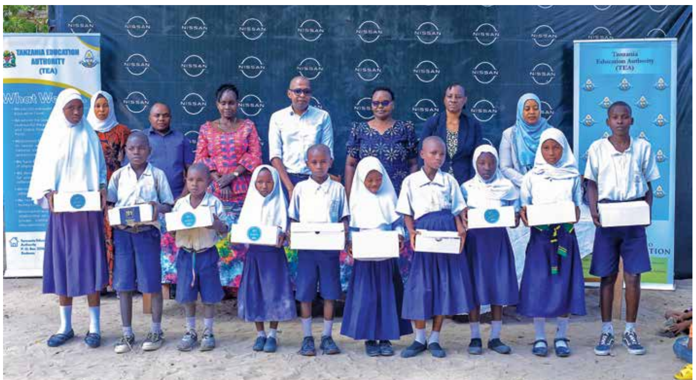
Kampuni ya NISSAN TANZANIA kwa kushirikiana na Mamlaka ya Elimu Tanzania wakikabidhi viatu vya shule kwa watoto wanaosoma katika mazingira magumu Wilayani Bagamoyo, Mkoani Pwani.

Pamoja na hayo amewaomba wadau mbalimbali kusaidia ujenzi wa uzio ili kukwepa uvamizi wa wanyama ambao wamekuwa wakisababisha uhalibifu wa mali za shule.