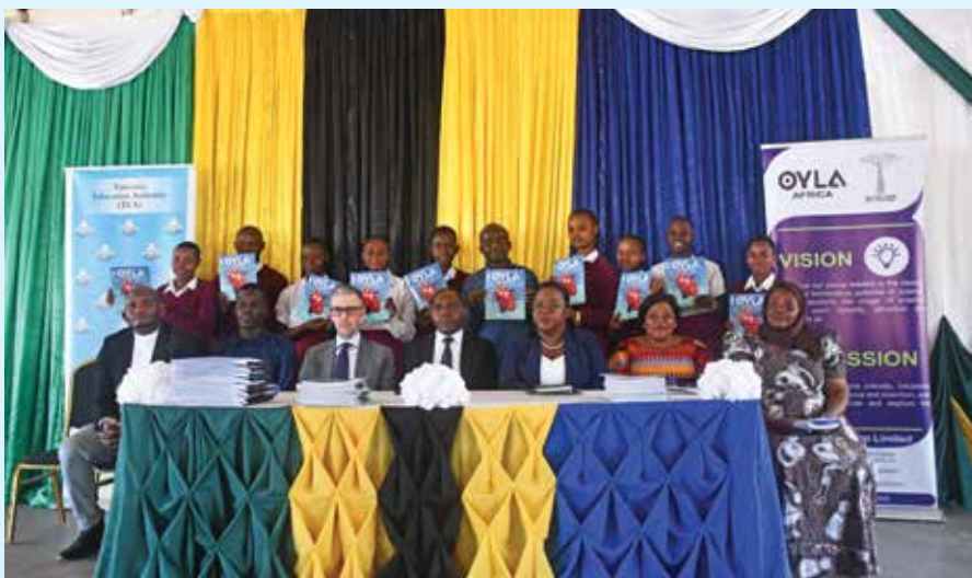
Baadhi ya wanafunzi katika picha ya pamoja na Mgeni Rasmi wakiwa wameshika magazeti ya OYLA Africa yaliyotolewa Kampuni ya Baobab Shalom Limited ya jijini Dar es Salaam.

TEA imeshukuru kampuni ya Baobab Shalom Limited kwa kutoa msaada huo wa majarida kupitia Mfuko wa Elimu unaosimamiwa na TEA na kuongeza kuwa iko tayari wakati wote kushirikiana na wadau wa elimu na kuwahakikishia kuwa misaada ya elimu inayopita kwenye Mfuko wa Elimu wa Taifa inasimamiwa kikamilifu na kutumika kama ilivyokusudiwa.