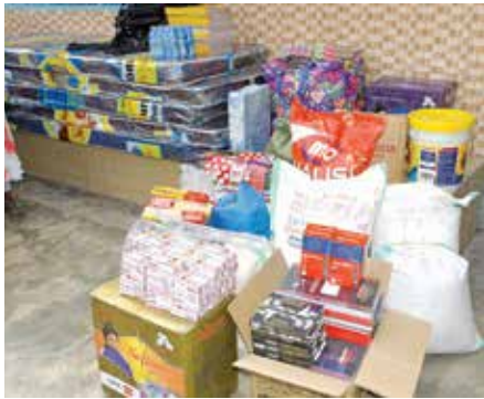
Sehemu ya mahitaji yaliyokabidhiwa kwa watoto yatima katika kitua cha CHAKUWA kilichopo Sinza, Dar es Salaam.

watoto yatima katika kituo cha CHAKUWAMA kilichopo Sinza jijini Dar es Salaam katika hafla fupi ya makabidhiano iliyoifanyika 19 Julai 2023.